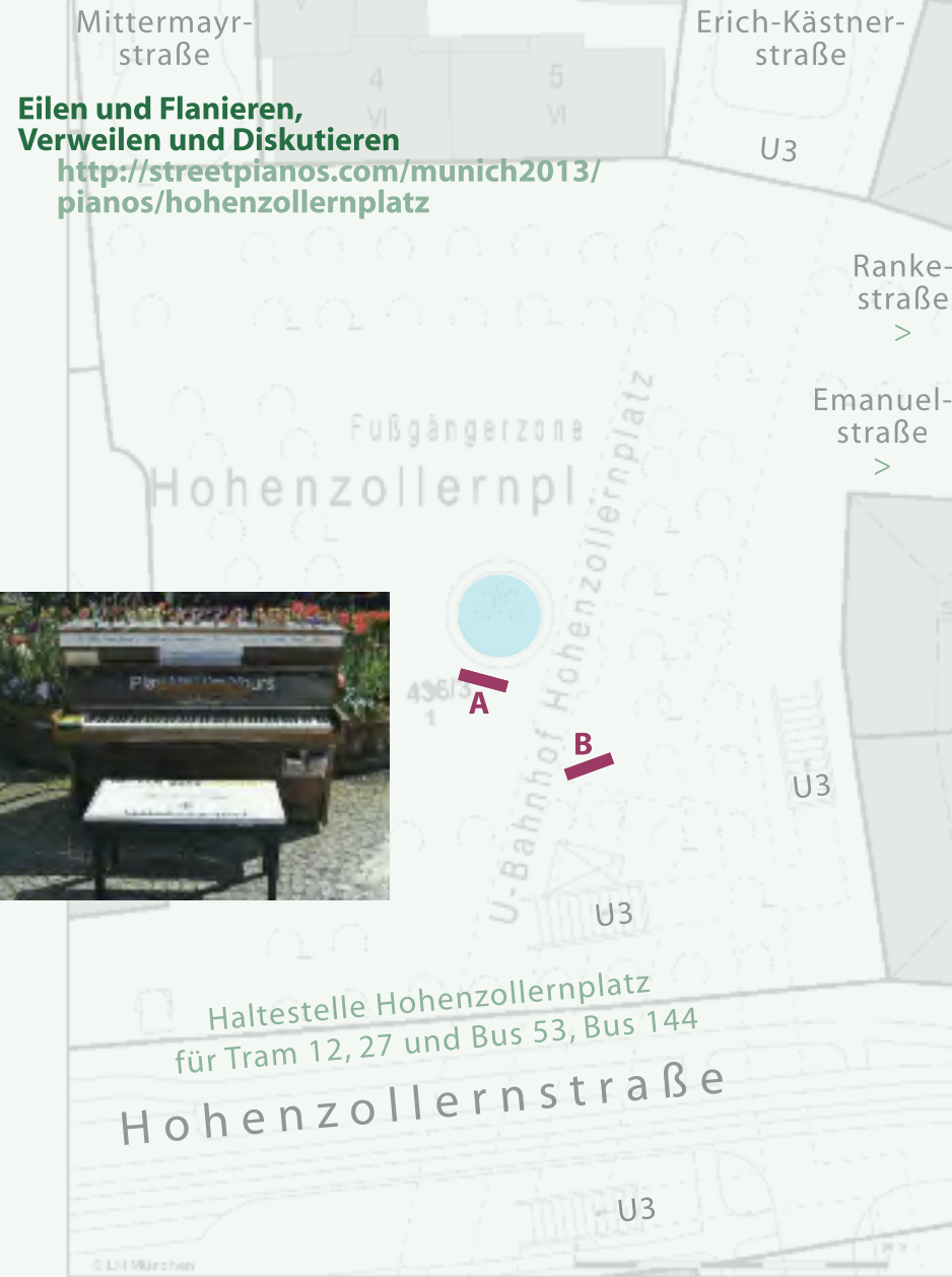
Der Hohenzollernplatz in Schwabing-West. Das Komponistinnen-Klavier stand zunächst nah am Brunnen (A), dann etwas entfernter (B).